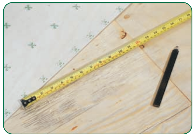
Desplace el borde del panel de los bordes del contrapiso 12" (305 mm) como mínimo (todos los paneles).