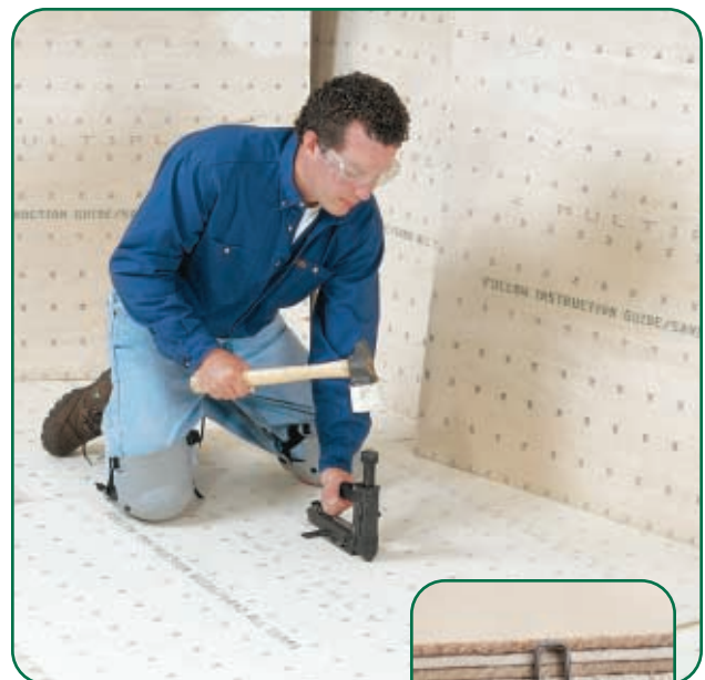
Clave las cabezas de los sujetadores 1/16" (1,6 mm) por debajo del nivel del piso y asegúrese de que penetren de un 75% a un 90% en el contrapiso.