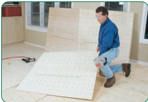
Coloque y sujete cada panel por separado.